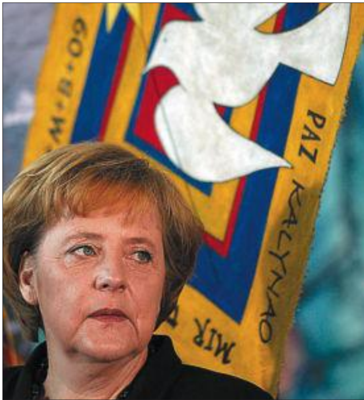
La canciller alemana, Angela Merkel, ayer en Berlín.

En el horizonte aparecen también las elecciones federales de septiembre, que enfrentarán a la canciller Angela Merkel (líder de los democristianos de la CDU) con el socialdemócrata del SPD Frank-Walter Steinmeier, actual ministro de Exteriores. Pero el plan no estará listo antes de mediados de mes, ya que los partidos deben limar previamente sus diferencias. Los so-