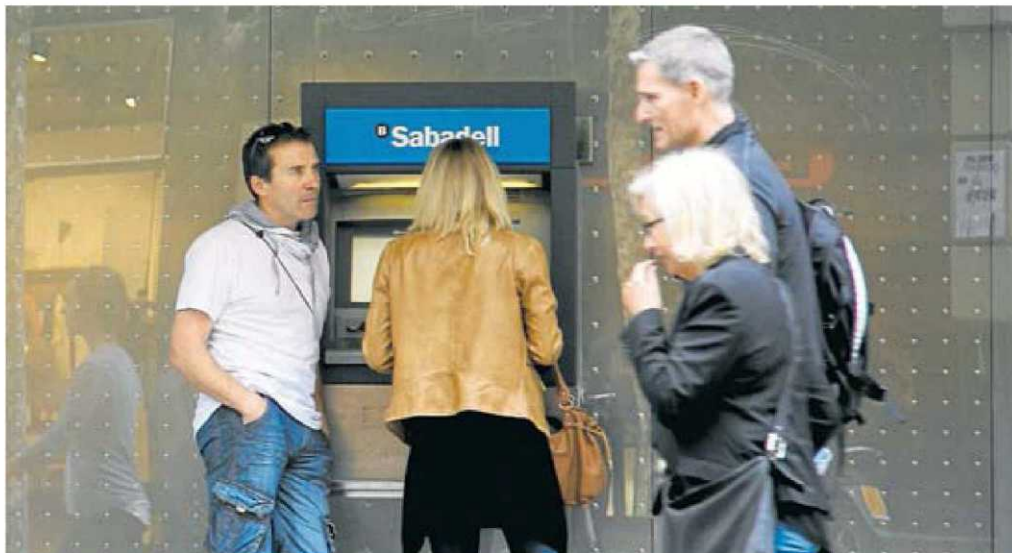
El client deixarà de pagar una doble comissió (al seu banc i al propietari del caixer) per retirar diners.

La fi dels contractes de temporada relacionats amb el turisme va ser en bona part responsable de la pujada de l'atur a Espanya i Catalunya.