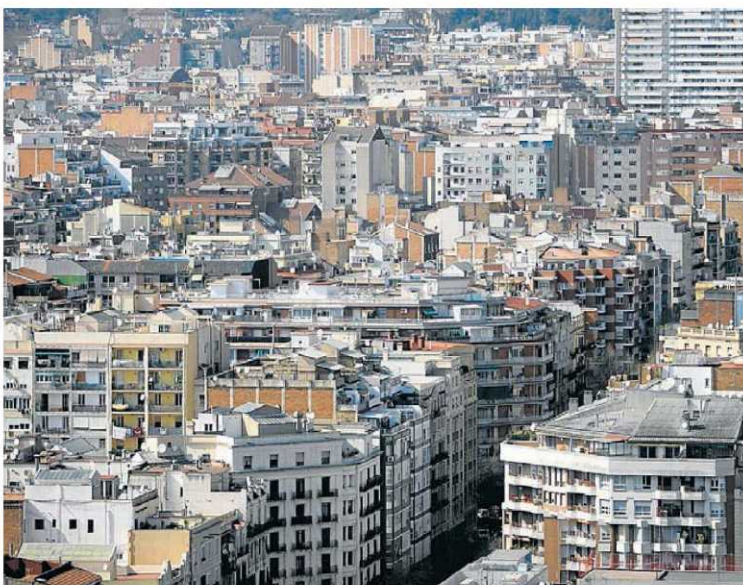
Barcelona va liderar les vendes de pisos a Catalunya en el primer semestre, amb 39.529 compravendes. El 2007, el millor any, en aquest semestre se'n van vendre 66.877. P. TORDERA

En el conjunt de l'Estat, el pes de les vendes d'habitatge nou és d'un 18% del total, amb un increment de només el 2,8% des de principis d'any. Les estadístiques de l'INE mostren també el poc pes de l'habitatge protegit: tant a l'Estat com a Catalunya, només un 10% de les operacions es van fer en aquest subsector.