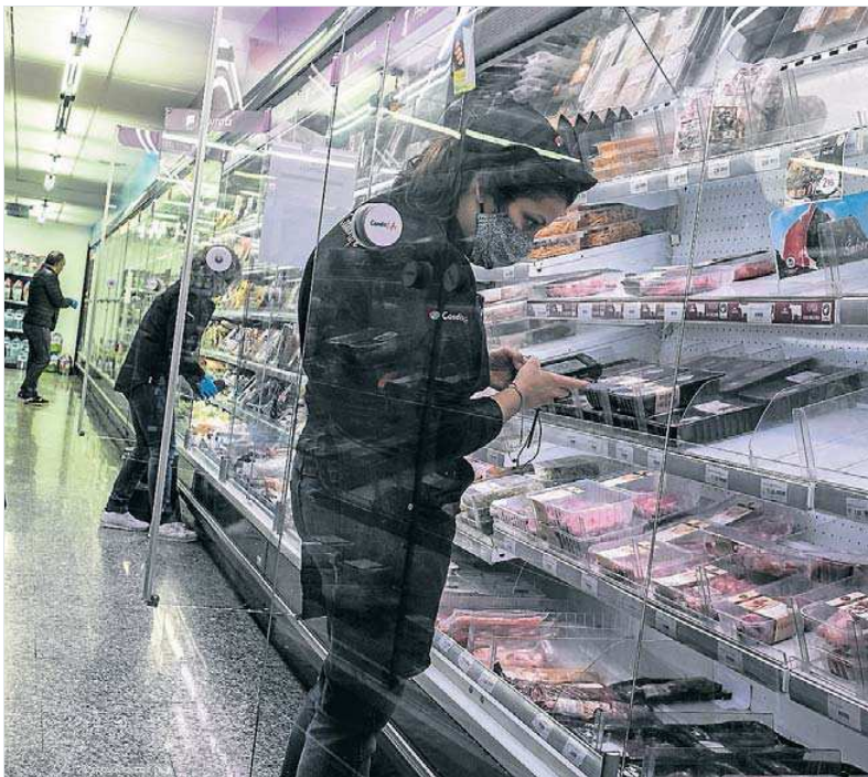
El preu dels aliments és el que va pujar més a l'abril. XAVIER BERTRAL

Malgrat la caiguda generalitzada, alguns productes, sobretot d'alimentació, van experimentar fortes pujades. Els llegums i hortalisses són el que es va encarir més, un 10,4% respecte al març. En la mateixa línia, les pizzes van pujar