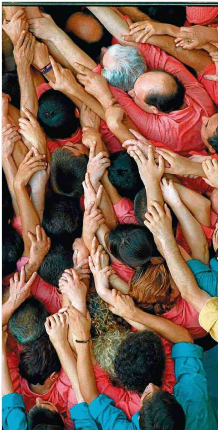
La solidaritat, element imprescindible en cada actuació d'una colla castellera ■ F.M. / ARXIU

sitat de reorganitzar la societat des d'una austeritat ben entesa, que no vol dir precisament retallades a tort i a dret.