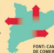
FONT: CAMBRA DE COMERÇ