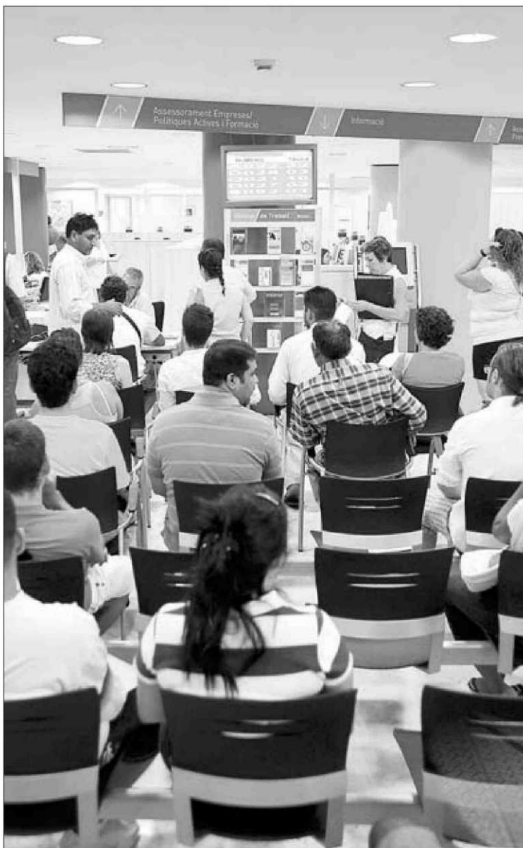
Un grupo de desempleados en una oficina del Inem en Barcelona.

El empleo es el gran perdedor del derrumbe económico. Más de 4 millones de parados esperan con pocas expectativas la recuperación