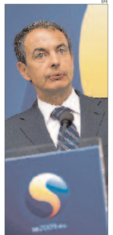
Zapatero, dilluns, a Estocolm.