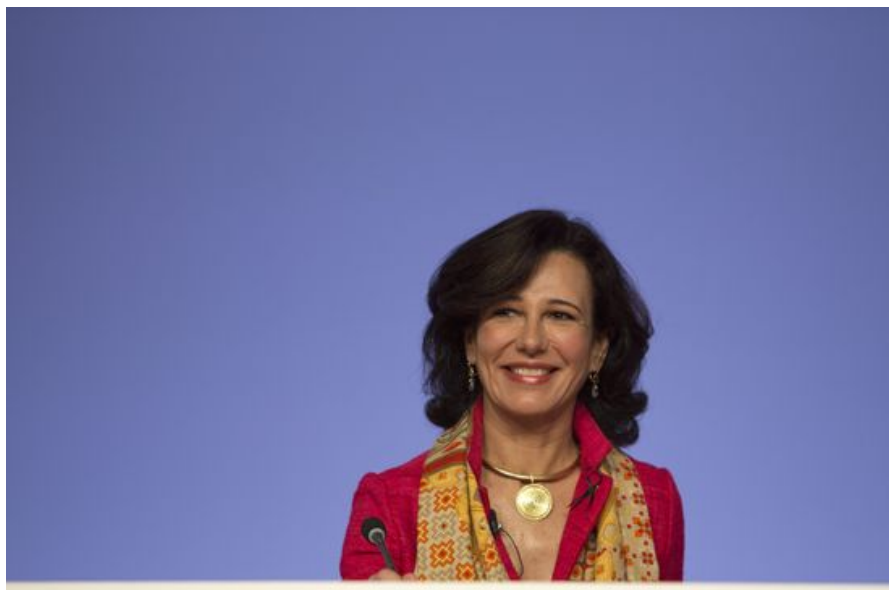
Ana Patricia Botín, presidenta de Banco Santander, es la 18ª mujer más poderosa del mundo.