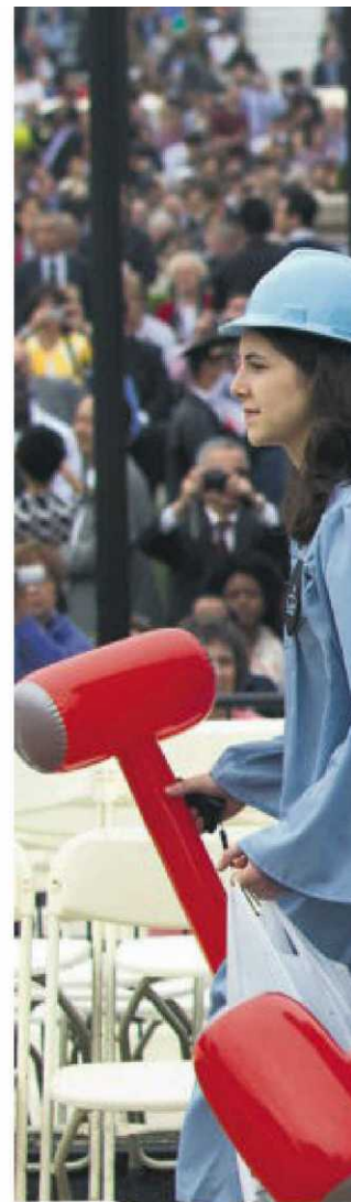
Licenciados de la escuela de Ingeniería de la Universidad de Columbia durante la ceremonia de graduación.

A pesar de todo, la situación en general en Europa, en cuanto a una posible burbuja universitaria, no es comparable a la estadounidense, pues los precios de las carreras son, en general, mucho menores, exceptuando algunas escuelas de negocio muy caras, recuerda el experto en educa-