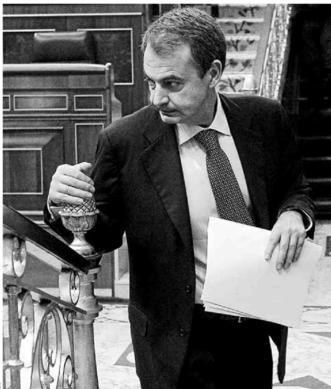
El presidente del Gobierno, José Luis Rodríguez Zapatero, ayer, durante la sesión de control.