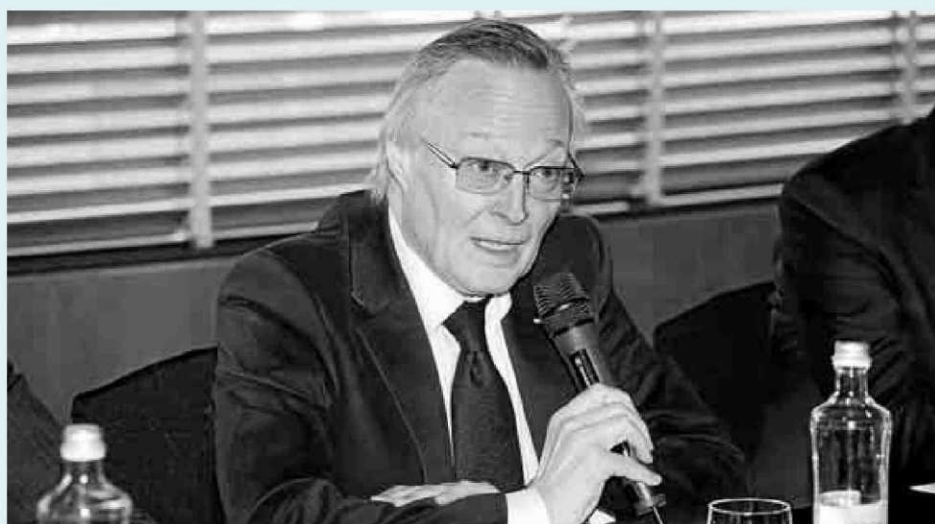
JOSEP PIQUÉ Consejero delegado de OHL y exministro de Asuntos Exteriores del PP

El consejero delegado de OHL también pidió debatir sobre la educación y sobre la recuperación de los símbolos del Estado en Cataluña, entre otros puntos. Piqué planteó una reforma de la Carta Magna, que debería ser referendada por todos los españoles. “Mentalidad abierta, pero reforma constitucional no como punto de partida para dar respuesta a unas demandas, sino como punto de llegada; nuestros nietos ya verán lo que hacen en 2050”, apuntó.