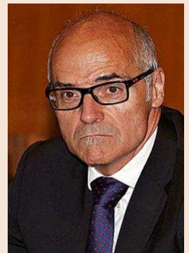
JOSÉ GARCÍA MONTALVO Catedrático de Economía de la Universidad Pompeu Fabra

La máxima que debe presidir cualquier medida laboral debería ser la flexiseguridad, con flexibilidad para las empresas para adaptarse a la crisis reforzando los instrumentos útiles para salvar empleo. Así conviene potenciar las suspensiones temporales de contrato de forma mucho más potente, la modificación de condiciones laborales y la contratación extraordinaria. Sólo de esta manera conseguiremos que las empresas puedan salir adelante sin quiebras masivas. Del lado de la seguridad, debemos extremar las medidas de protección de la seguridad y salud de los trabajadores para ayudar, desde la actividad empresarial, a evitar nuevos rebrotes de la pandemia. Ante situaciones extraordinarias, medidas laborales extraordinarias.