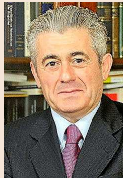
VALENTÍN PICH Presidente del Consejo General de Economistas

La clave del éxito, según muestran las experiencias de Corea y Taiwán, está en hacer el mayor número de test, aislar los casos positivos y seguir la huella de los que han estado en contacto con ellos a la vez que se permite al resto de actores operar libremente (trabajar, estudiar, etcétera), aunque con precauciones. Obviamente, las personas en riesgo deberían seguir aisladas durante mucho más tiempo. La apertura es absolutamente necesaria, pero hay que tomar las precauciones necesarias, si no el impacto sobre la economía española va a ser enorme. El número de test ha aumentado, pero no lo suficiente, y todavía no tenemos información fiable para saber qué personas han estado cerca de los casos positivos. Sin esta información vamos a ciegas, pero al menos podremos aislar más casos.