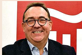
JOSÉ LUIS YZUEL Presidente de Hostelería de España

Hay sectores condenados (floristerías que operan de forma online, por ejemplo) donde la quiebra es algo positivo. Para los sectores que van a retomar su actividad en tres meses, un préstamo es suficiente. Para los sectores que van a retomar su actividad cuando el 70% de la población esté inmunizada, la deuda subordinada puede funcionar. Sin embargo, hay otros sectores donde la situación es más complicada. ¿Qué va a pasar con los cines y teatros? ¿Qué va a pasar con Iberia?