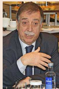
Eugeni Gay Exvicepte del Tribunal Constitucional

tractores de la secesión. Para facilitar el consenso, Ramon Adell instó a todos los actores a admitir sus “errores”, y en este punto, el presidente del