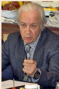
Carlos Tusquets Presidente de Mediolanum

“La disposición adicional que reconoce el sistema foral es lo más imperfecto que tiene nuestra Constitución”