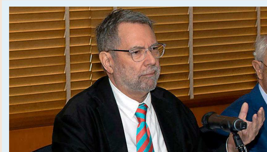
Enric Ucelay-Da Cal Catedrático emérito de Historia Contemporánea

En los últimos meses, las diferencias entre las principales caras visibles del secesionismo se han intensificado: Artur Mas (PDeCAT) quiere volver a ser candidato; Carles Puigdemont aspira a seguir liderando el independentismo desde su autodenominado “exilio” en Waterloo (Bélgica) mientras que el exnúmero dos del Govern entre 2016 y 2017, Oriol Junqueras, sigue liderando con mano de hierro la organización que preside desde 2011, ERC.