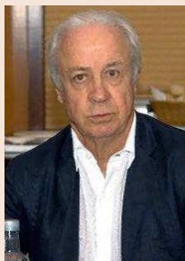
Carlos Tusquets Pte. de Trea y de Banco Mediolanum

“Estamos pagando un coste muy alto, a nivel social y económico, por el populismo institucional en la Generalitat”