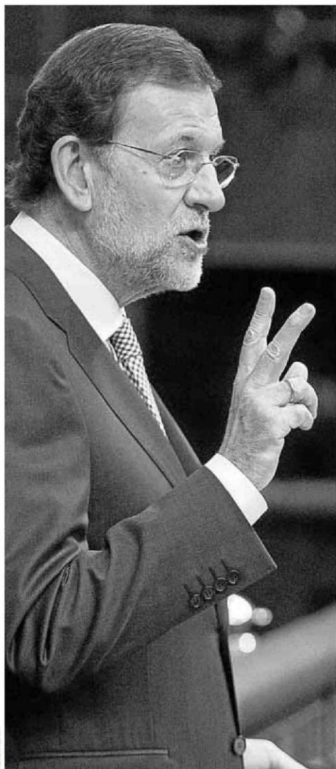
El presidente, Mariano Rajoy, hace un año, en el Congreso.

La más dolorosa de las medidas fue el incremento del IVA. El tipo general, en tres puntos, del 18% al 21%. Y el reducido, del 8% al 10%. El objetivo, recaudar 2.300 millones adicionales en 2012 y 7.834 millones más en 2013, según los datos de Hacienda, en 2012 se cumplió el objetivo y se recaudaron 2.441 millones más. Y en 2013 -de enero a mayo- la recauda-