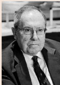
José Luis Bonet Presidente de Freixenet

“ Hay desequilibrios en la solidaridad y en su gestión y su permanencia no resolverá el problema, lo va a fosilizar”