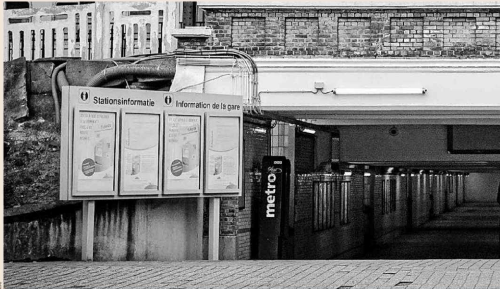
Soldados belgas patrullan la estación de metro de Schaarbeek, en Bruselas, ayer.

Con todo, muchos analistas creen que el golpe político a la UE puede ser mayor que el golpe económico. "La factura del 22-M es una mayor incertidumbre política, ya que deteriora el liderazgo de Merkel e inclina la balanza hacia posturas menos respetuosas con los principios de la democracia liberal y la economía de mercado" subraya Diego