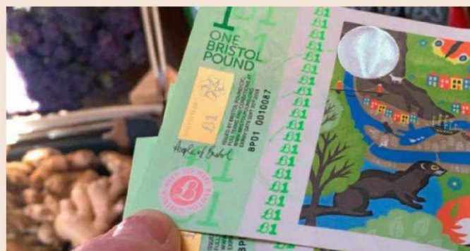
En Bristol (Reino Unido), han impreso billetes de su moneda con varios sistemas de seguridad.

pymes locales y buscan un efecto multiplicador en la economía. En cambio, hay diferencias significativas, como quién es su impulsor —si la Administración o una entidad privada—, si la moneda pierde valor o no con el paso del tiempo y si siempre es intercambiable con la moneda oficial. Hay proyectos que se dirigen a toda la población y otros sólo a pymes o a los que se asocian al programa. En varios municipios, la iniciativa va acompañada de un plan de microcréditos en condiciones ventajosas. Las primeras experiencias de moneda local en Europa y Estados Unidos nacieron en la Gran Depresión de los años 30, aunque duraron