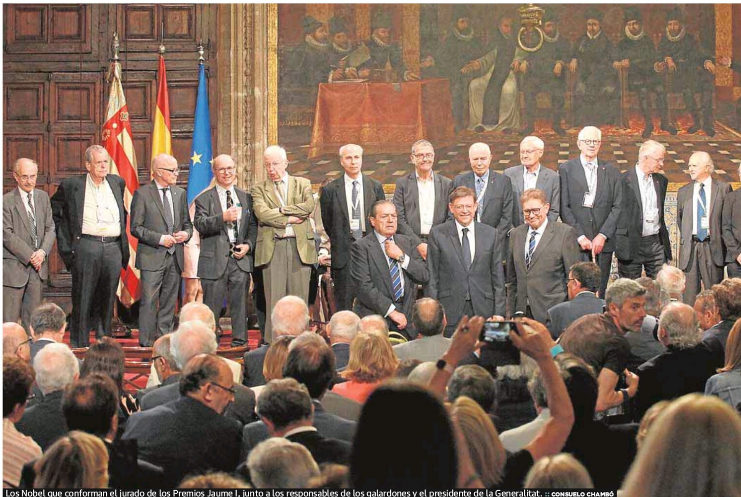
Los Nobel que conforman el jurado de los Premios Jaume I, junto a los responsables de los galardones y el presidente de la Generalitat. :: CONSUELO CHAMBÓ