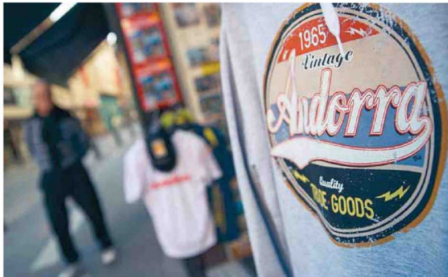
Un turista passeja a la vora d'una botiga de regals, a Andorra la Vella.

Es parla d'un esdevenidor més diversificat, però quin és l'estat de salut dels sectors tradicionals? Pel que fa al comerç, com diu Escaler, "encara és el primer motiu de visita per al turista, que aprecia que hi hagi una gran concentració comercial per practicar la compra com a lleure, ara que el diferencial de preu ja no és tan decisiu". És per això que "els comerciants, fins i tot en temps de crisi, han invertit per diferenciar-se".