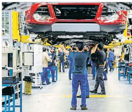
Cadena de Ford en Almussafes