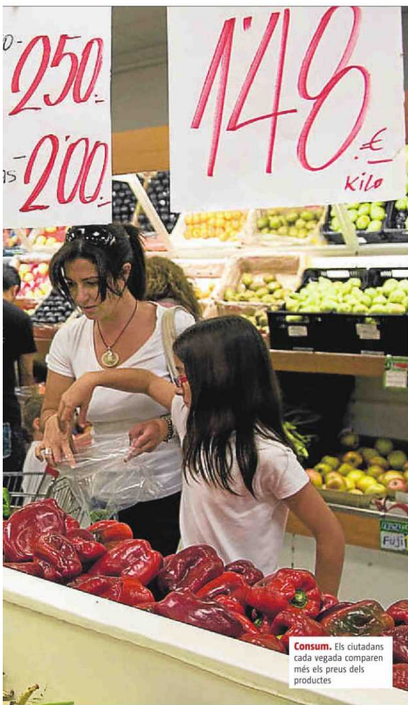
Consum. Els ciutadans cada vegada comparen més els preus dels productes

Entre el 2006 i el 2010, Espanya va perdre un 7% del seu PIB